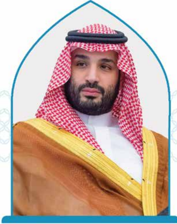
صاحب السمو الملكي ولي العهد

الأمير محمد بن سلمان بن عبدالعزيز آل سعود